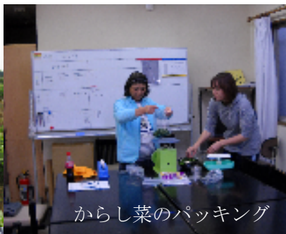
からし菜のパッキング