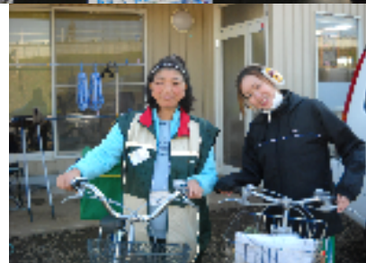
メール便の配達に出発!