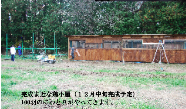
完成ま近な鶏小屋 (12月中旬完成予定) 100羽のにわとりがやってきます。