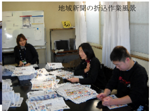
地域新聞の折込作業風景