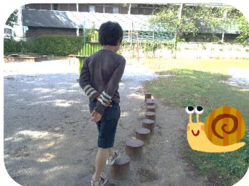
公園で遊ぶのもシャボン玉も楽しいね♪