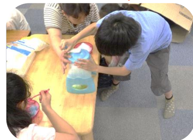
シロップ全部混ぜちゃった☆