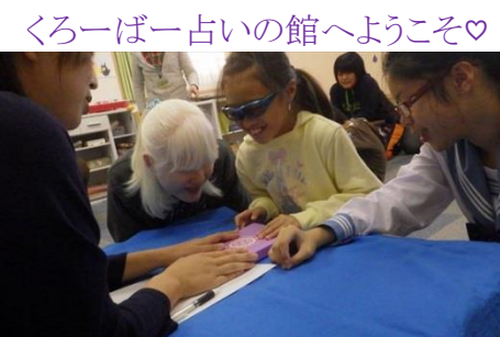
くろーばー占いの館へようこそ♡