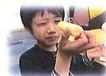
真ん中に穴が開いていない うまい棒を見つけました☆