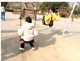
♪ 上座公園 ♪