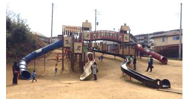
☆ 黒澤池公園 ☆